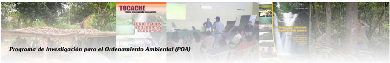
Programa de Investigación para el Ordenamiento Ambiental (POA)