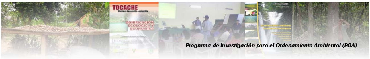
Programa de Investigación para el Ordenamiento Ambiental (POA)

liderada por el Municipio Provincial de Tahuamanu, con el apoyo técnico del Convenio IIAP-WWF. La experiencia cuenta con el apoyo del Gobierno Regional Madre de Dios y de la Comisión Regional de ZEE y OT Madre de Dios. Asimismo, está siendo monitoreada por el Consejo Nacional del Ambiente (CONAM), en tanto experiencia piloto para validar una propuesta metodológica para la formulación de planes de ordenamiento territorial a escala municipal.