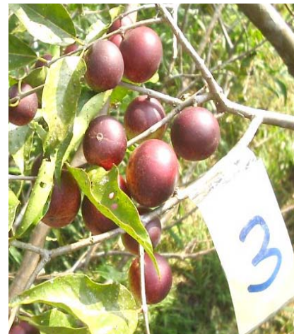
Frutos autofecundados de camu camu